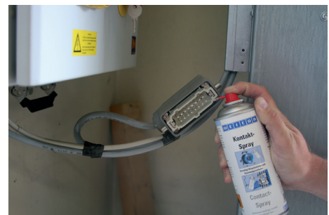
Steckverbindung an Hallentoren

Alle in diesem Prospekt enthaltenen Angaben und Empfehlungen stellen keine zugesicherten Eigenschaften dar. Sie beruhen auf unseren Forschungsergebnissen und Erfahrungen. Sie sind jedoch unverbindlich, da wir für die Einhaltung der Verarbeitungsbedingungen nicht verantwortlich sein können, da uns die speziellen Anwendungsverhältnisse beim Verwenden nicht bekannt sind. Eine Gewährleistung kann nur für die stets gleichbleibende hohe Qualität unserer Erzeugnisse übernommen werden. Wir empfehlen, durch ausführende Eigenversuche festzustellen, ob von dem angegebenen Produkt die von Ihnen gewünschten Eigenschaften erbracht werden. Ein Anspruch daraus ist ausgeschlossen. Für falschen oder zweckfremden Einsatz trägt der Verarbeiter die alleinige Verantwortung.