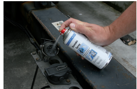
Steckverbindungen an Nutzfahrzeug-Anhängern